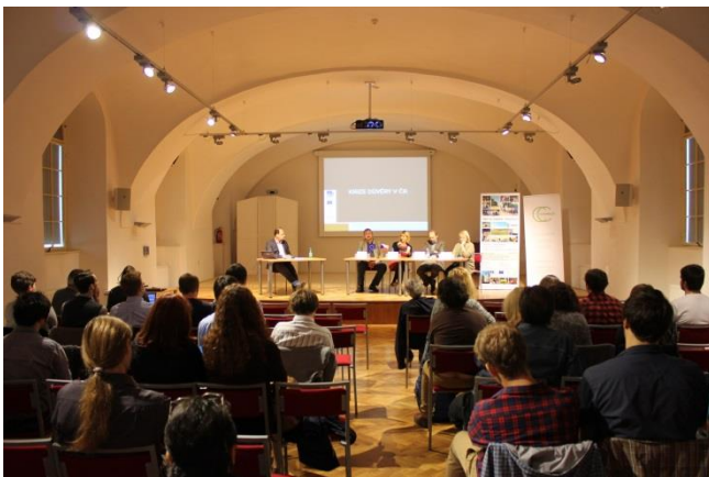
Obrázek 3: Konference Otevřená společnost 2014, Olomouc.