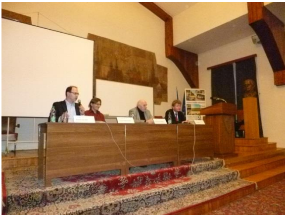
Obrázek 2: Právo a politika v ČR, Olomouc.