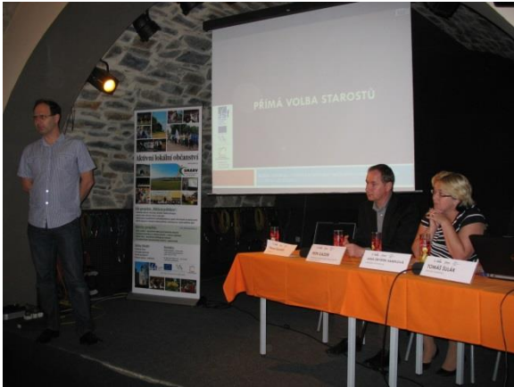
Obrázek 1: Přímá volba starostů, Hranice.