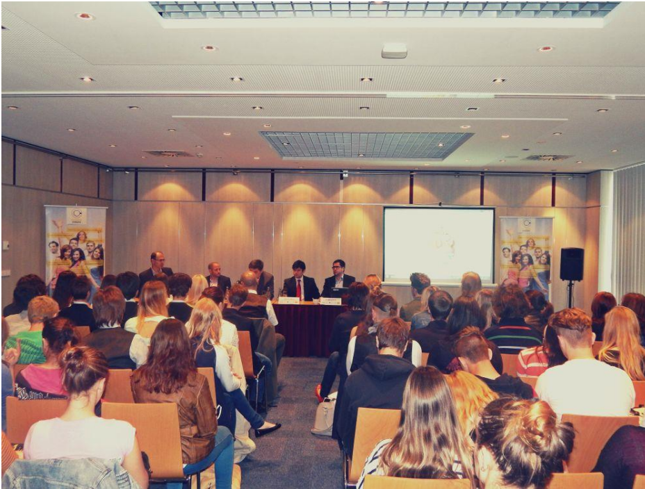
Obrázek 1: Kavárna Evropa - závěrečná konference